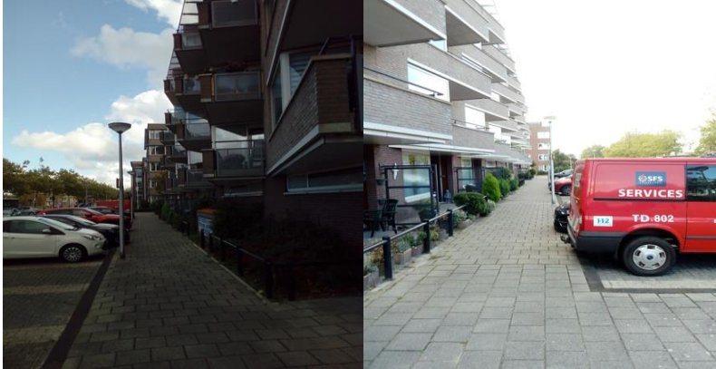
Foto van de ombudsman, de straat van mevrouw S. waarop te zien is dat twee lantaarnpalen dichterbij de gevel zijn geplaatst dan alle andere lantaarnpalen in de straat.