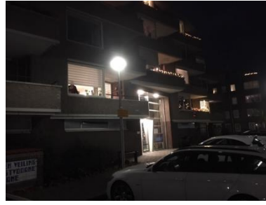
Foto van de ombudsman, één lantaarnpaal (nummer 31) staat direct voor het raam van de huiskamer van mevrouw S.